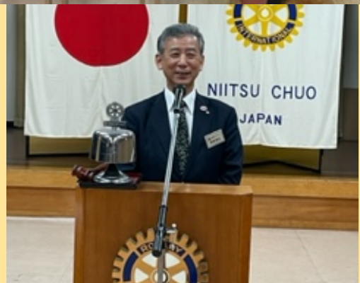
諸橋会長エレクト中締めのご挨拶