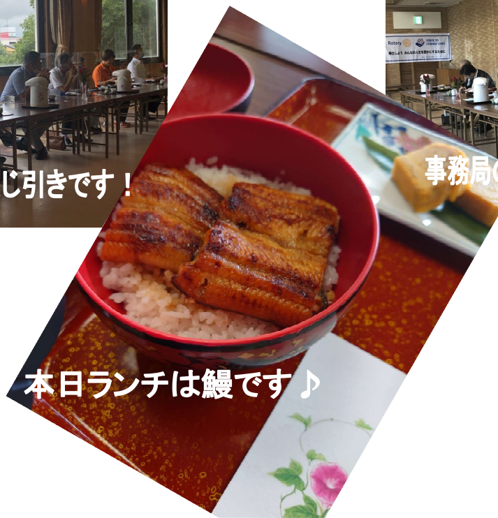
本日ランチは鰻です♪