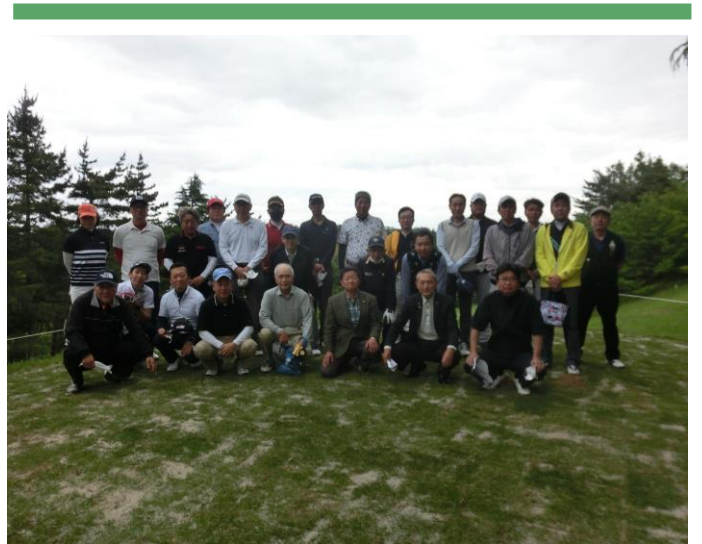
先週の日曜日開催された第三分区ガバナー補佐杯ゴルフコンペの様子