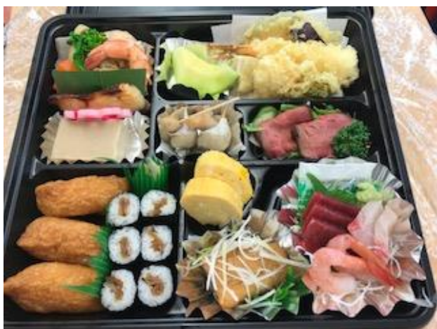
本日の特別お弁当☆彡