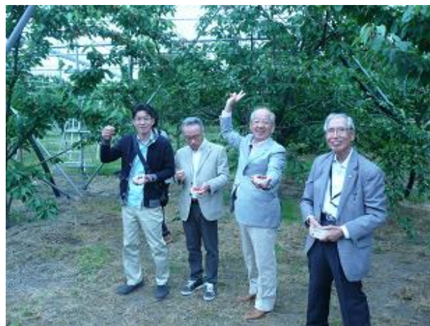
さくらんぼたくさんとれたぞー！！