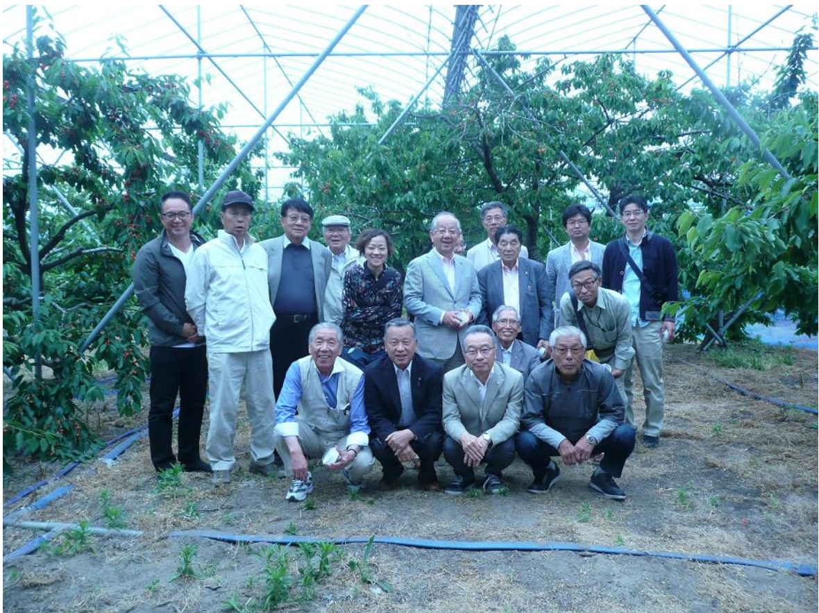
聖籠の天野農園に到着。これからさくらんぼ狩りをします。

行 程 一 楽 聖籠にて さくらんぼ狩り 聖 籠 9:00 新潟バイパス 10:00 着 30 分 11:00 発 新潟バイパス 万代島船乗船 船中飲食 万代島 14:00 着 一 楽 15:00 着