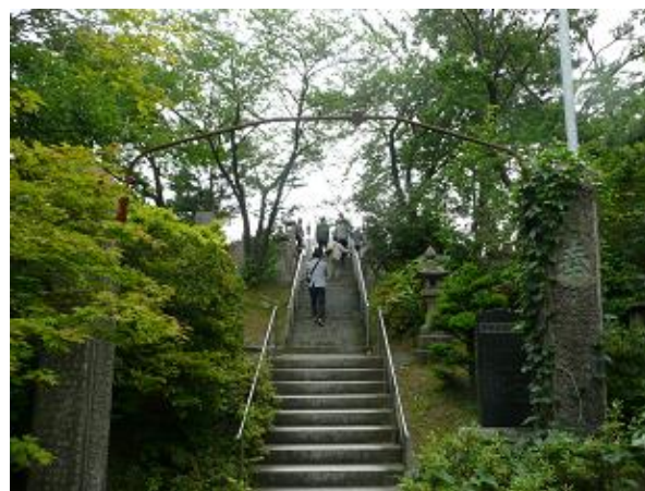
新潟市北区のパワースポット 太郎代観音を見学