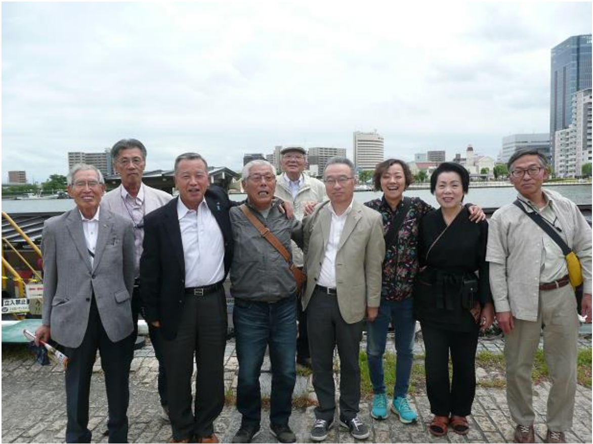
これから屋形船「ぼんだい丸」で約2時間、信濃川を遊覧しながら宴会です。