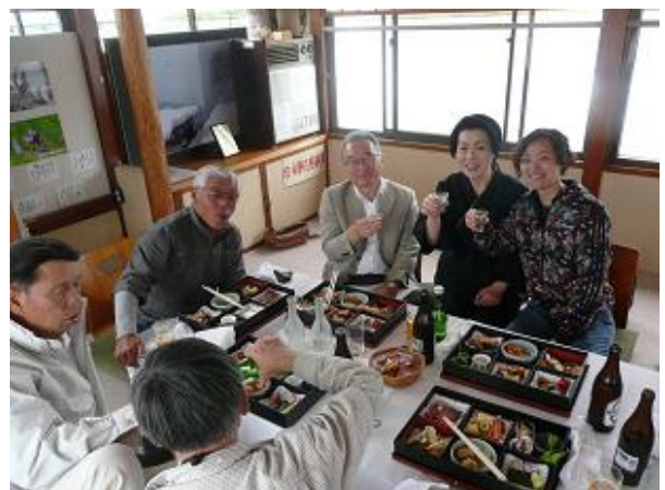
船にゆられて、美味しいお料理とお酒をいただき、ゆったりした時を過ごせました。