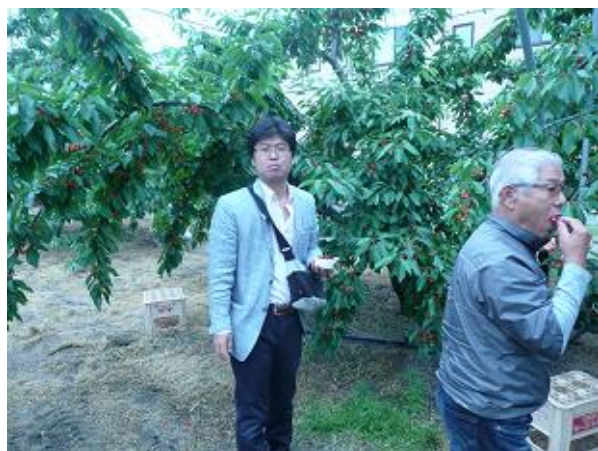
すっぱかったのかなー？