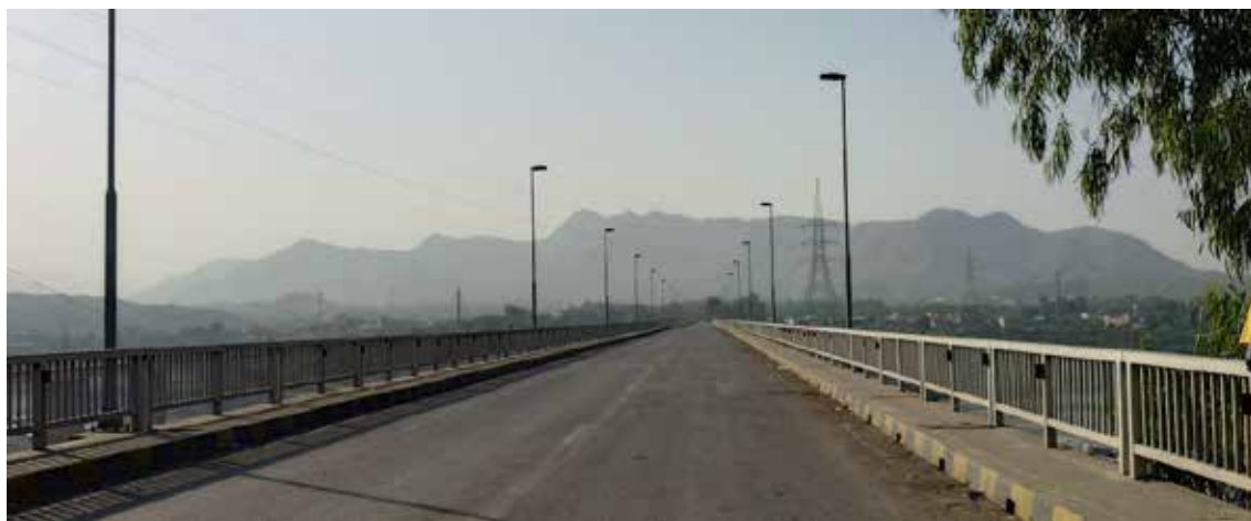
インダス川にかかる橋、奥の山々の麓はペシャワール、山の向こうにカイバル峠