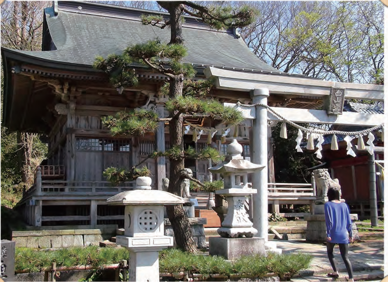
白山大神社大祭；5月3、4日に毎年神樂と十萬石の大名行列が旧北国街道を練り歩きます。