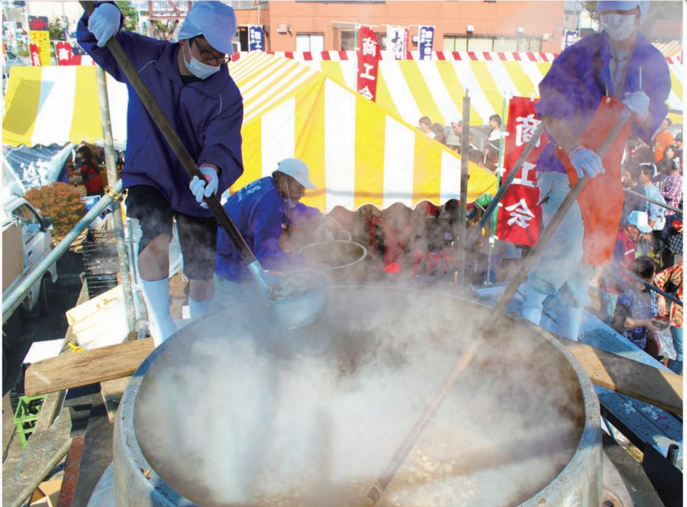
こしじ秋祭り：一万こなべ