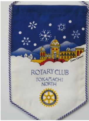
十日町北ロータリークラブ