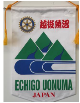
越後魚沼ロータリークラブ