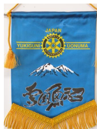
雪国魚沼ロータリークラブ