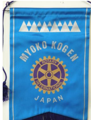
妙高高原ロータリークラブ