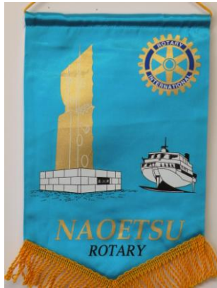
直江津ロータリークラブ