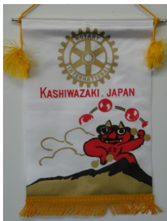
柏崎ロータリークラブ