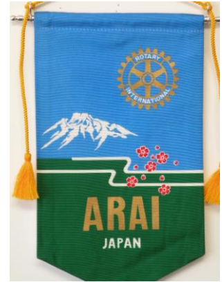
新井ロータリークラブ