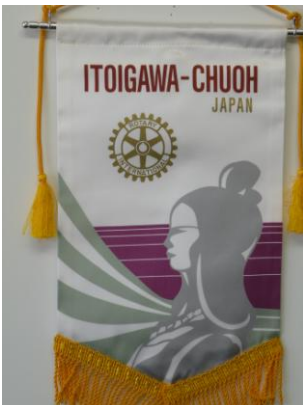
糸魚川中央ロータリークラブ