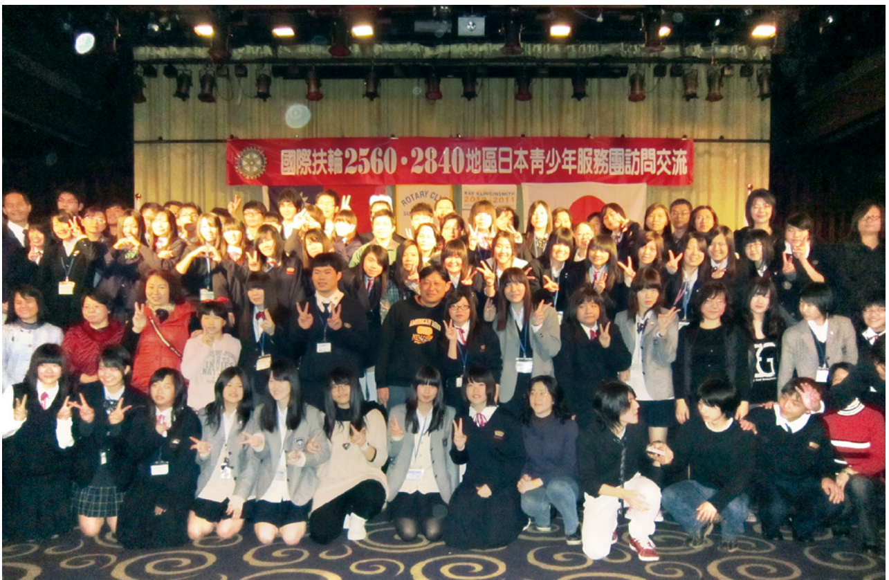
インターアクト台湾海外研修 3月24から27日の日程で、2560・2840の地区共同事業であるインターアクト海外研修に、インターアクター(新潟10名・群馬18名)、ロータリアン他総勢35名が参加。

国際ロータリー第2560地区 2010～2011年度「ガバナー月信」2011年5月1日発行