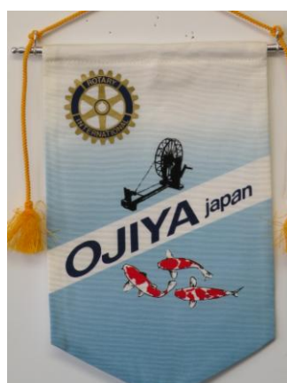
小千谷ロータリークラブ