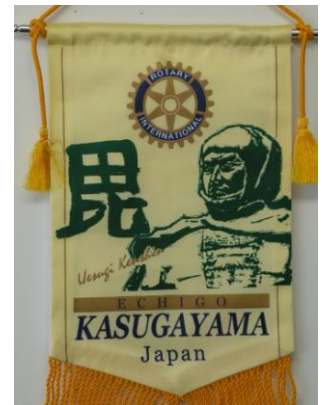
越後春日山ロータリークラブ