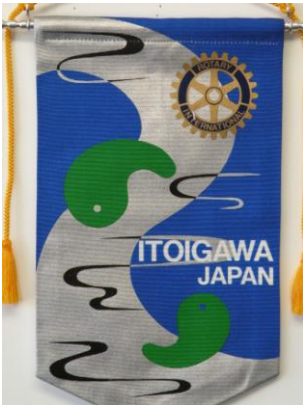
糸魚川ロータリークラブ