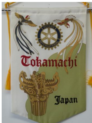
十日町ロータリークラブ