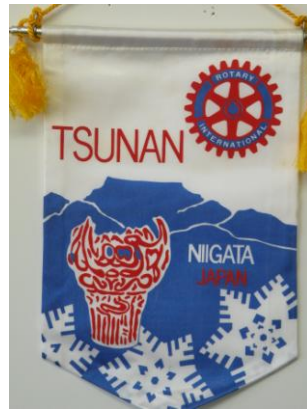
津南ロータリークラブ