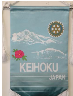
頸北ロータリークラブ