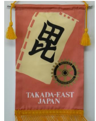
高田東ロータリークラブ