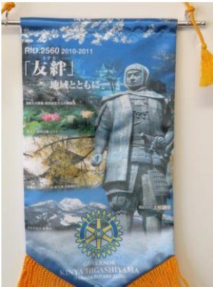
高田ロータリークラブ