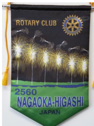
長岡東ロータリークラブ