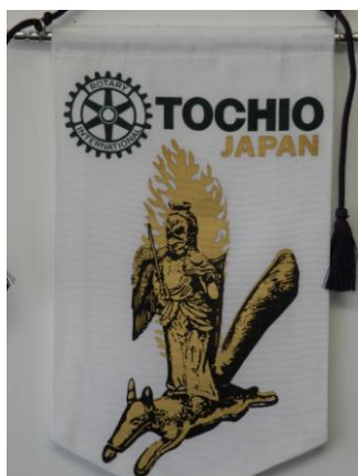
栃尾ロータリークラブ