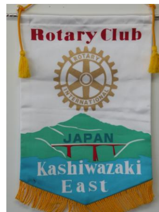
柏崎東ロータリークラブ