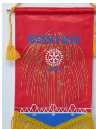
長岡西ロータリークラブ