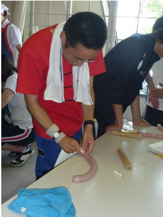
フランクフルト製造体験