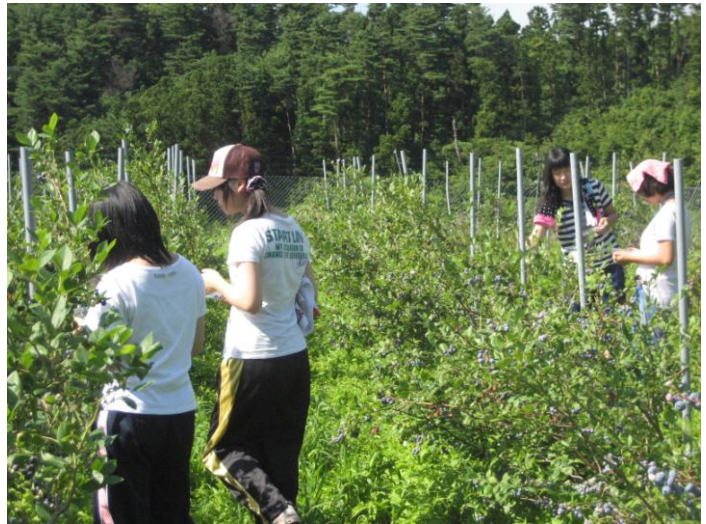
ブルーベリー摘み体験