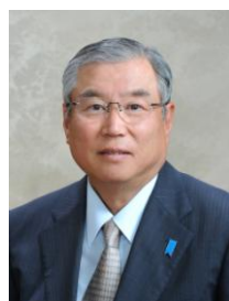
神初周吉 新潟西RC 7月8日入会 NPO法人あさひの家