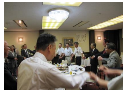
最後はみんなで手に手つないで!!