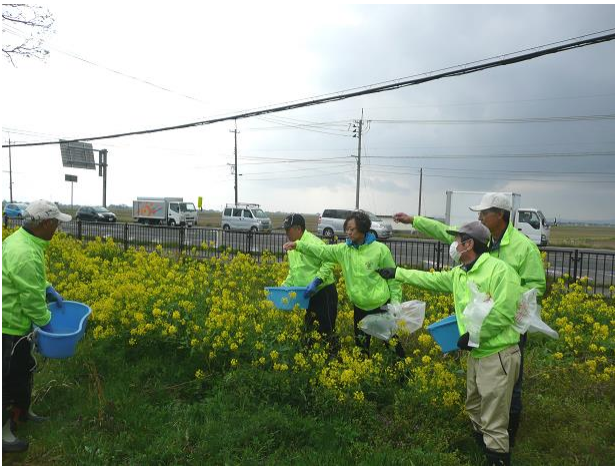
きれいに咲いてね！！