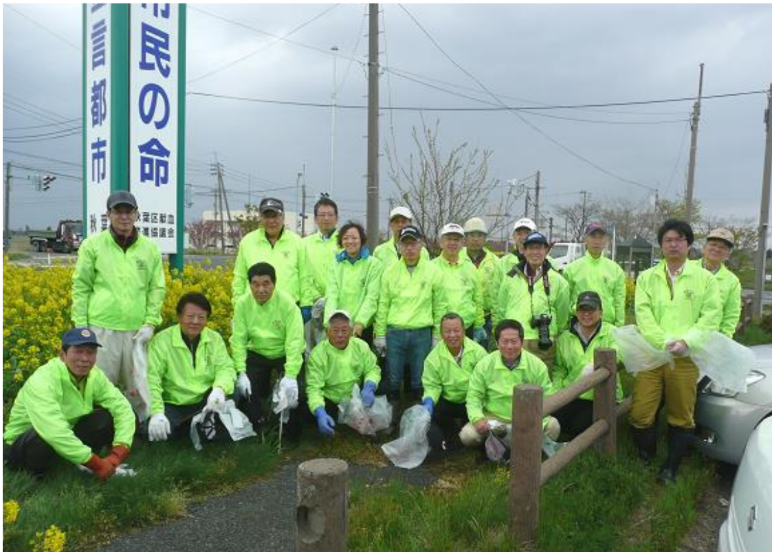
作業前に全員集合！！皆さん頑張りましょう。

恒例の国道 403 号線フラワーロード清掃作業と、ロータリー財団地区補助金事業「国道 403 号線花 いっぱいフラワーロード」として肥料散布と看板立てを行いました。