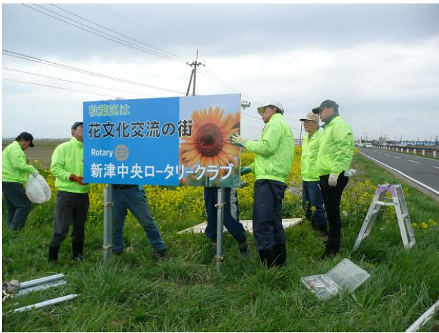
何度も修正して・・・