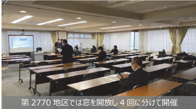
第2770地区では窓を開放し4回に分けて開催

4月から新学年度が始まりました。 4月7日、新型コロナウイルスの全国的な感染拡大を受け、7都府県に緊急事態宣言が発令されたことから、当会では翌8日付で、2020学年度の新規奨学生および継続奨学生に対し、「挨拶ならびに大切なお知らせ」として、現在の状況説明、今後守るべき諸注意事項などをホームページに掲載すると共に、各人にメールで送信しました。 例年、4月に各地区で開催される米山奨学生のオリエンテーションについては、4月13日現在、中止が16地区、延期が11地区となっております。