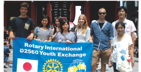
初めての江戸文化に感激

発表をいたしました。独学生は日本語で、そして日本の学生は英語と独語でのスピーチとなりましたが、わずかな時間で学生それぞれが努力し発表を考え、一生懸命に話す姿を見て感動をいたしました。お互いが共に経験したことは、彼らには一生の思い出として心に残るものでしょう。そして夢をきつといつか実現してくれるものと信じています。