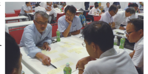
熱の入ったワークショップ