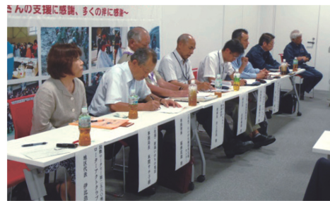
連携諸団体の代表の皆様