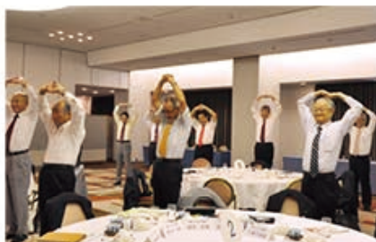
初披露の YONEYAMA 体操でリフレッシュ

また午後のセッションでは、「よねやま親善大使に聞く 10 の質問」「米山奨学事業での心に残る体験（ロータリーモーメント）卓話」に続いて、グループディスカッションを行いました。特に、グループディスカッションは「米山奨学事業の課題を検討できた」「各地区の問題点、悩みなどを具体的に聞けて良かった」と好評でした。お忙しい中、セミナーにご参加いただいたガバナーエレクトの皆さまに、心から感謝申し上げます。