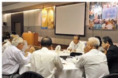
グループに分かれて真剣にディスカッション