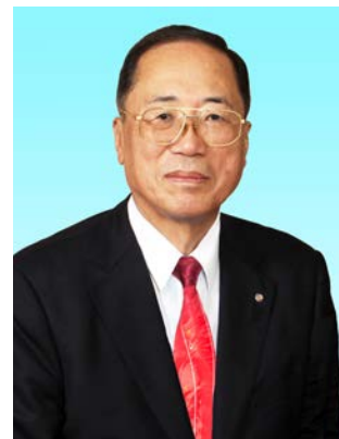
国際ロータリー第2560地区 ガバナー 佐々木 昌敏