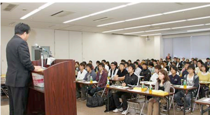
-第12回ライラ研修会-