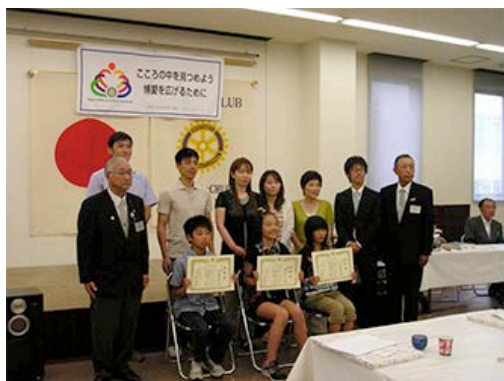
-「ぼくの夢・わたしの夢」作文表彰式-

その他、糸魚川ジオサイトの1つでありますフォッサマグナミュージアム地内の草刈りや、市内で開催されている各種イベントへの協賛を行い、地域活性化を目的とした奉仕活動を実行しています。