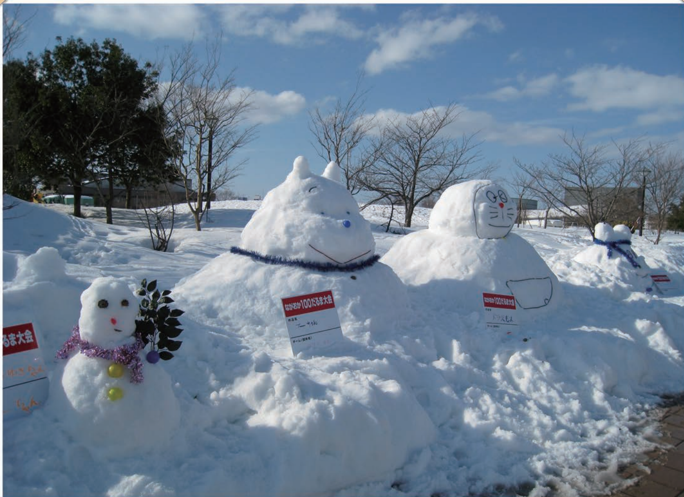
長岡雪しか祭りの雪像群。