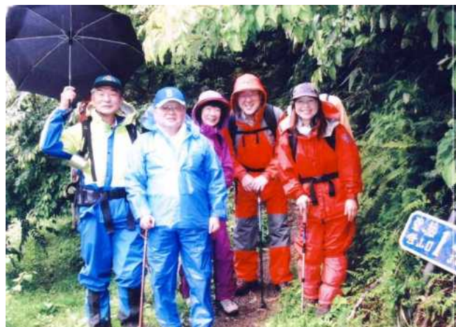
山頂目指していってきます！