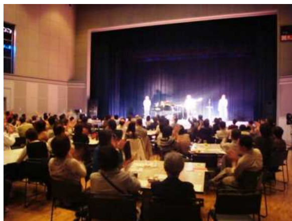
生のシャンソンに包まれて・・・