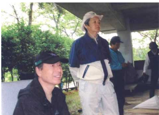
大いに親睦を深めることが出来ました

「山の会」の歴史は、1992 年、平標山から始まり、今年の粟ヶ岳で 18 山目になりました。皆様のご協力で、悪天候にもかかわらず安全に粟ヶ岳登山が出来ました事、厚く感謝申し上げます。