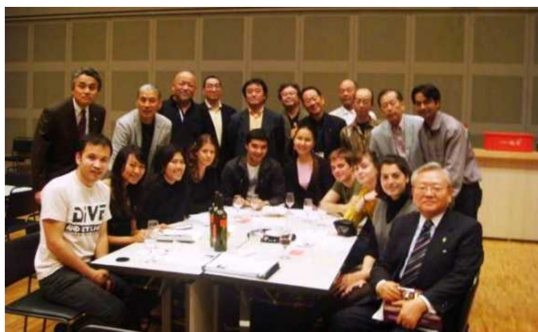
シャンソンの夕べ参加者