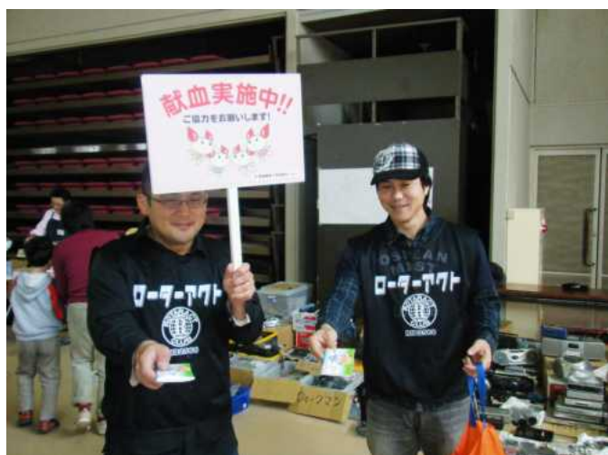
多くの来場者より献血に協力いただきました

このイベントを通じて多くの皆様との出会いがあり人と人との繋がり的重要性を改めて実感したものになったと思えます。