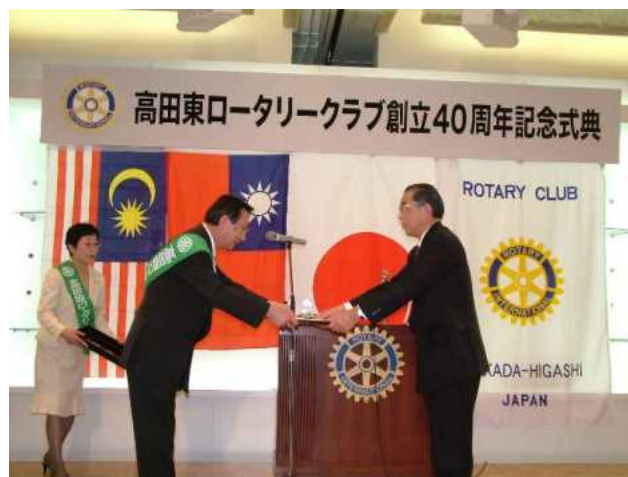
上越高校インターアクトクラブへの感謝状贈呈