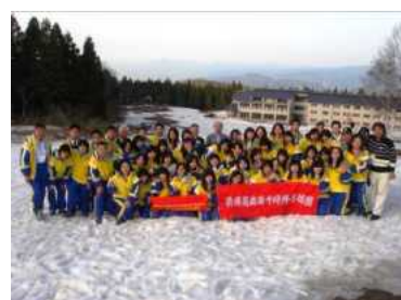
来日受入・雪遊び体験