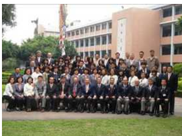
清傳高級商業職業学校訪問

ただ残念なことに一部には、厳しい状況時にインタラクティブ海外事業に予算付は無駄という人がいるが、まず台湾へ行ってみることに、自分の見識を広げるためにもお勧めするし、地区役員も苦勞も考えてからもの申してほしい。今後もこの海外交流事業が継続発展し、生徒達が世界に羽ばたくリーダーになることを祈念して感想としたい。