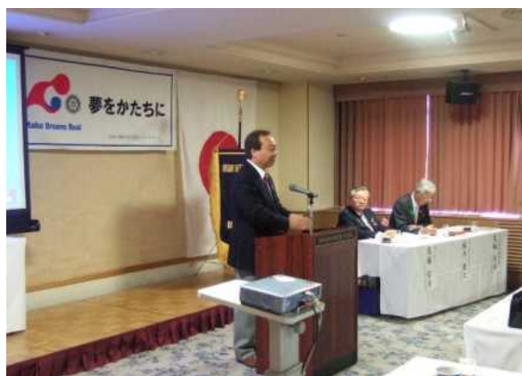
箕輪委員長：カウンセラー制度・役割とは