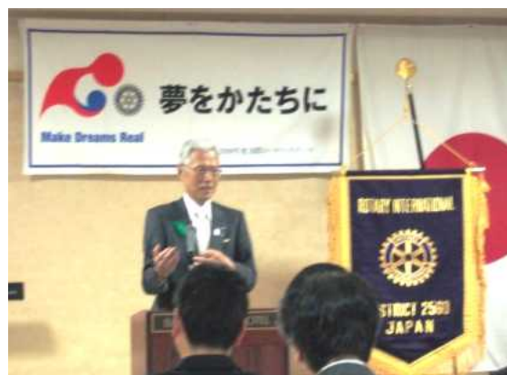
植木ガバナー・エレクト：講評および閉幕