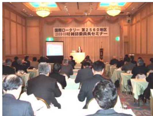
ご参加の皆様、有り難うございました。