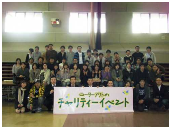
ローターアクター一丸となりイベントは大成功でした