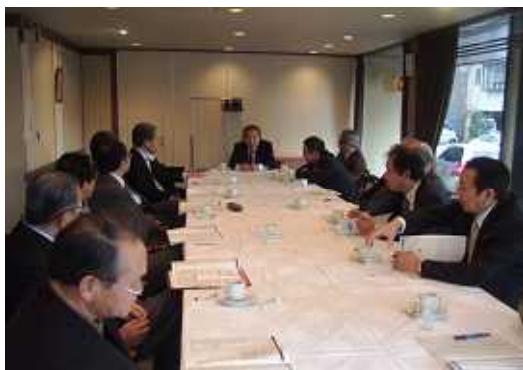
分区別討論の様子